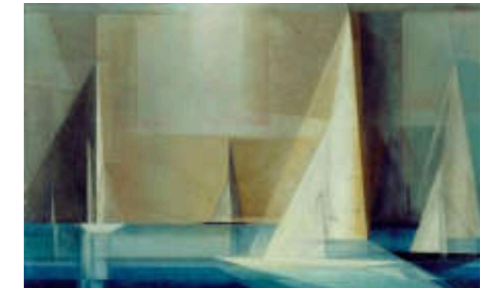
Lionel Feininger: Schärenkreuzer

Auftraggeber:in Stadt Romanshorn Programm Umgebungsgestaltung Campus Verfahren Projektwettbewerb 2021, 1. Preis Projektierung ab 2022 Rolle Landschaftsarchitektur Partizipierende Parteien Graf Biscioni Architekten, Winterthur Umgebungsfläche